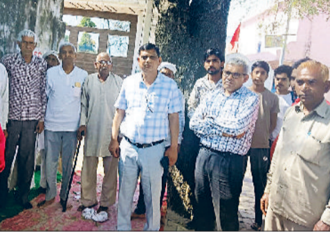
रेवाड़ी। ग्रामीणों को जागरूक करते हुए पुलिस टीम।