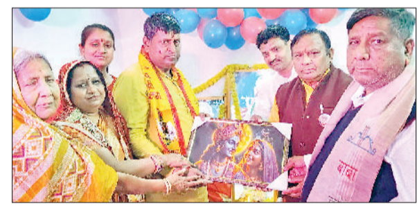
नारनौल। यजमान को स्मृति चिह्न भेंट करते हुए।

महेन्द्रगढ़। राव जयराम स्कूल के अनेक छात्रों ने देश की प्रतिष्ठित सैनिक स्कूल प्रवेश परीक्षा में शानदार सफलता प्राप्त कर न केवल अपने परिवार और शिक्षकों का मान बढ़ाया है, बल्कि पूरे क्षेत्र का नाम भी रोशन किया है। छात्रों की इस उपलब्धि से विद्यालय परिसर में उत्सव जैसा माहौल बना हुआ है। गौरतलब है कि सैनिक स्कूलों में प्रवेश के लिए आयोजित परीक्षा दशमर्ग में अत्यंत प्रतिस्पर्धी मानी जाती है।