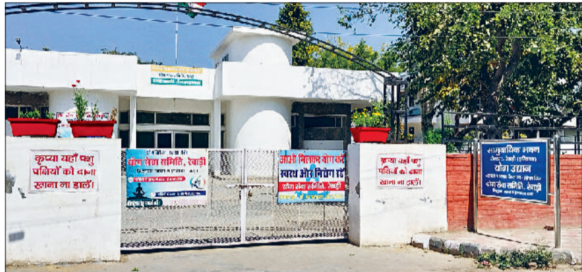
रेवाड़ी। सेक्टर-3 स्थित कम्युनिटी सेंटर का हुआ सौंदर्यकरण।

सेक्टर-4 स्थित कम्युनिटी सेंटर की दशा 41 लाख रुपये से सुधारी जा रही है, वहीं कृष्ण नगर स्थित कम्युनिटी सेंटर की मरम्मत के लिए 66 लाख रुपये, माड़ावास रोड स्थित आदर्श नगर के कम्युनिटी सेंटर पर 77.83 लाख तथा नयागांव दौलतपुर में स्थित कम्युनिटी सेंटर की मरम्मत पर करीब 61.87 लाख रुपये खर्च किए जा रहे हैं।