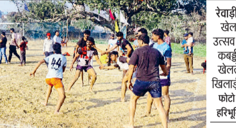
रेवाड़ी। खेल उत्सव में कबड्डी खेलते खिलाड़ी।