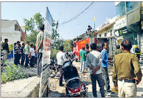
रेवाड़ी। गोदाम में लगी आग बुझाते फायर ब्रिगेड कर्मी।

मॉडल टाउन में रविवार सुबह एक जूते और कपड़ों के गोदाम में आग लगने से लाखों रुपये का सामान जलकर राख हो गया। फायर ब्रिगेड ने कड़ी मशक्कत के बाद आग पर काबू पाया। मौके पर पहुंची पुलिस ने आगजनी के कारणों की जांच शुरू कर दी। मॉडल टाउन में जूतों और कपड़ों का बड़ा गोदाम बेसमेंट में है। रविवार होने के कारण गोदाम बंद था। सुबह करीब 10 बजे गोदाम से धुआं निकलना शुरू हो गया। आसपास के लोगों ने गोदाम मालिक और फायर ब्रिगेड को सूचना दी। सूचना मिलने के बाद फायर ब्रिगेड की गाड़ी मौके पर पहुंच गई। गोदाम के शीशे तोड़कर आग पर काबू पाने के प्रयास शुरू किए गए। मॉडल टाउन थाना पुलिस भी मौके पर पहुंच गई। फायर ब्रिगेड ने आग पर काबू तो पा लिया, लेकिन तब तक गोदाम में रखा सामान जलकर राख हो चुका था। आग लगने का कारण शॉर्ट सर्किट माना जा रहा है। पुलिस इसकी जांच कर रही है।