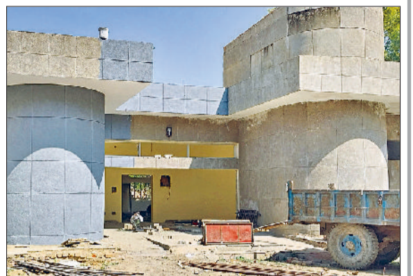
रेवाड़ी। सेक्टर-4 स्थित कम्युनिटी सेंटर में चल रहा मरम्मत कार्य।

शहर के चार कम्युनिटी सेंटरों का मरम्मत कार्य पहले ही संपन्न हो चुका है। इनमें सेक्टर-3 के सेंटर पर 21 लाख 59 हजार रुपये खर्च किए गए। इसके अलावा इंदिरा गांधी कॉलोनी में स्थित सेंटर में 12 लाख 50 हजार रुपये का कार्य किया गया। गुर्जरवाड़ा के कम्युनिटी सेंटर में 7.50 लाख और वार्ड नंबर 24 के सेंटर पर 15 लाख रुपये खर्च किए गए। इन कम्युनिटी सेंटरों में शौचालय, कमरे और बैठक हॉल सहित अन्य सुविधाओं का नवीनीकरण किया गया।