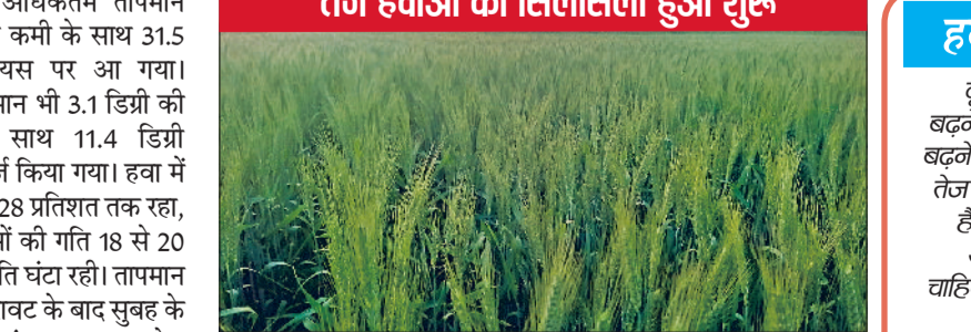
रेवाड़ी। एक खेत में पक रही गेहूं की फसल।

कारण रात के समय लोग चैन की नौद सो रहे हैं। गर्म कपड़ों की अब आवश्यकता नहीं पड़ रही। मौसम