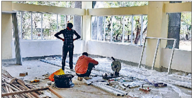
रेवाड़ी। सेक्टर-4 स्थित कम्युनिटी सेंटर की तैयार हो रही खिड़कियां।

इसके अलावा नप की ओर से शहर के तीन सामुदायिक भवनों की मरम्मत के लिए भी बजट जारी किया गया था। शहर के चार कम्युनिटी सेंटरों की मरम्मत पर 2.46 करोड़ रुपये खर्च किए जा रहे हैं।