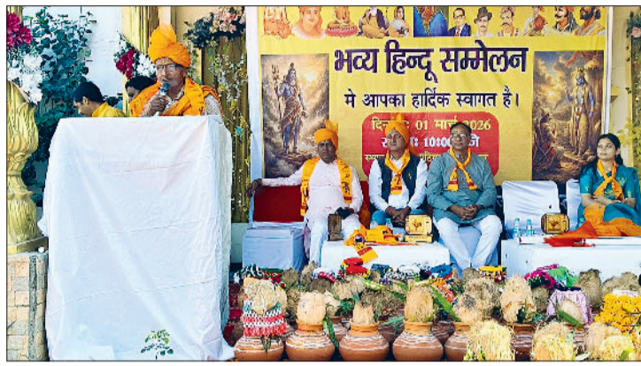
रेवाड़ी। हिंदू सम्मेलन में मौजूद महिलाएं, सम्मेलन में कार्यक्रम पेश करते हुए बच्चे तथा अपने विचार रखते हुए वक्ता।