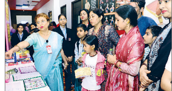
रेवाड़ी। विद्यार्थियों को जानकारी देते हुए शिक्षक।

हरिभूमि न्यूज ►► रेवाड़ी राज इंटरनेशनल स्कूल में रविवार को प्री-नर्सरी से कक्षा चौथी तक के विद्यार्थियों के लिए स्कॉलरशिप परीक्षा रंगीला बचपन डटेलेंट शो का आयोजन किया गया, जिसमें 572 विद्यार्थियों ने भाग लेकर विशेष ध्यान अपनी बौद्धिक, रचनात्मक एवं व्यवहारिक क्षमताओं का प्रदर्शन किया। परीक्षा का उद्देश्य विद्यार्थियों की केवल विषयगत जानकारी का मूल्यांकन करना नहीं, बल्कि उनकी समझ, तार्किक क्षमता, संश्लेषण कौशल, रचनात्मक सोच एवं गतिविधि आधारित अधिगम क्षमता को पहचानना था। विद्यालय प्रशासन की ओर से परीक्षा में उत्कृष्ट प्रदर्शन करने वाले