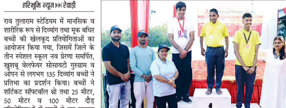
रेवाड़ी। खेल प्रतियोगिता के विजेताओं का पुरस्कृत करते अतिथि।